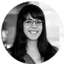
ESTHER MORALES ILUSTRACIÓN