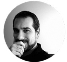
IGOR YGLESIAS ILUSTRACIÓN