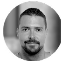
JAIME DE LA TORRE ILUSTRACIÓN