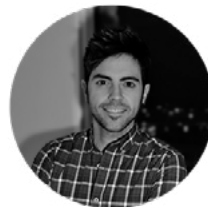
JUAN JESÚS MARTÍNEZ ILUSTRACIÓN