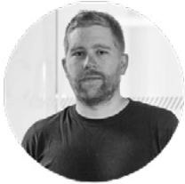
MARIO DE DIOS ANIMACIÓN