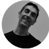
JUAN JOSÉ BRAVO ANIMACIÓN