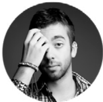
JAVIER PAJUELO ILUSTRACIÓN