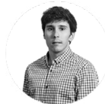
MANUEL JIMÉNEZ DESARROLLO WEB