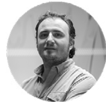
JAVIER BOHÓRQUEZ DISEÑO GRÁFICO