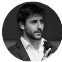
EDUARDO FIERRO DESARROLLO WEB