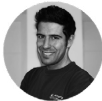
JESÚS PALACIOS DISEÑO GRÁFICO